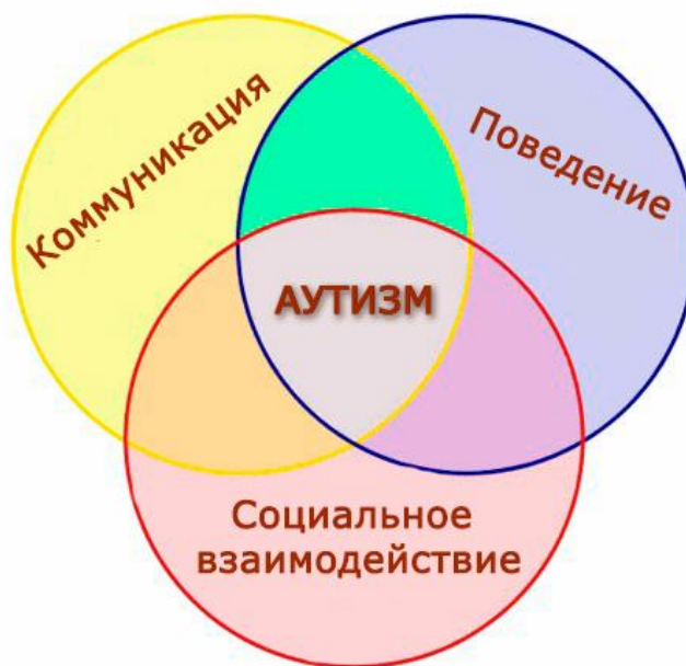
Рисунок 1. Триада нарушений при аутизме

Педагогам важно знать и понимать, каким образом организовать психолого-педагогическое сопровождение ребенка с РАС в детском саду, исходя из особенностей и потребностей ребенка, чтобы свести к минимуму продолжительность адаптационного периода к условиям детского сада, сделать его менее травмирующим психику ребенка.